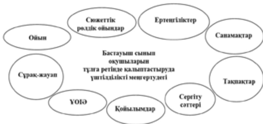
Сурет 4 – Бастауыш сынып оқушыларының тұлға ретінде қалыптастыруда үштілділікті меңгертудегі әдістер

Бастауыш сынып оқушыларының жеке тұлғасын қалыптастыруда үштілділікті меңгертуде отбасымен ынтымақтастық жұмысының ролі ерекше.