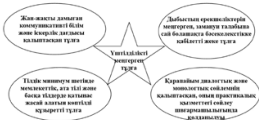
Сурет 6 – Үштілділікті меңгерген бала. Күтілетін нәтиже

Білім беру үрдісін жаңаша ұйымдастыру оның психологиялық-педагогикалық негіздерін, теориясы мен тәжірибесін тереңірек қайта қарау қажеті осындай қиыншылықтарды жеңе отырып, баланың жан-жақты, терең сапалы білім алуына бар мүмкіншілігімізді сала отырып баланың үштілділікті меңгерудегі нәтижесі.