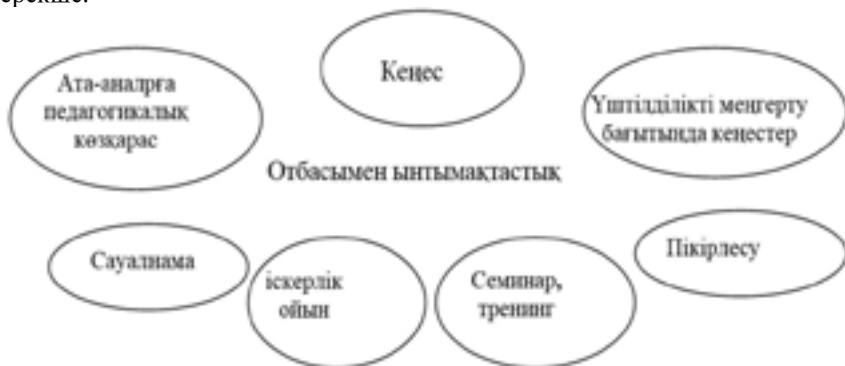
Сурет 5 – Отбасымен ынтымақтастықта жүргізілетін жұмыстар

Бастауыш сынып оқушыларының жеке тұлғасын қалыптастыруда үштілділікті меңгертуде отбасымен ынтымақтастық жұмысының ролі ерекше.