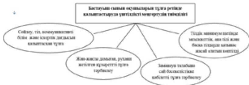
Сурет 1 – Бастауыш сынып оқушыларының тұлға ретінде қалыптастыруда үштілділікті меңгертудің тиімділігі

оқытуда баланың алған дағдылары мен әдістерін дамытып, нығайту үшін жағдай жасап, ұйымдастыру, міндетті түрде білім салаларымен жан-жақты байланыста болады.