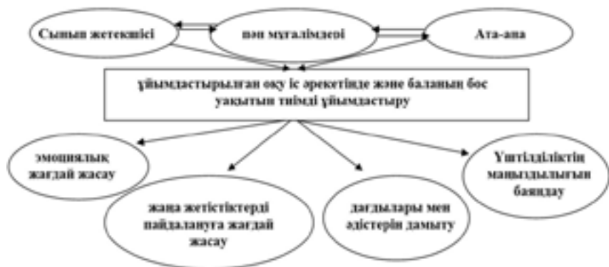
Сурет 3 – Бастауыш сынып оқушыларын жеке тұлғасын қалыптастыруда үштілділікті меңгерудің тиімді жолдары

Үштілділік бағытындағы оқытудың негізгі мақсаты – бастауыш сынып оқушыларының жас ерекшеліктеріне қарай, жалпы интеллектуалдылығы, сөйлеу деңгейін, оларға білімді меңгеруге бағдарламалық жағынан қамтамасыз ету, қазақ, орыс, ағылшын тілдеріне оқытуға дағдыландыру бағытында келесі әдіс-тәсілдер қолданылады.