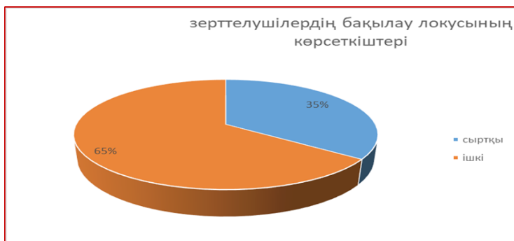
Сурет 3— жалпы барлық зерттелушілердің бақылау локусы бойынша нәтижелер диаграммасы

Диagramмадан көріп отырғанымыздай, 1–2 курс студенттерінің басым көпшілігінде сыртқы бақылау жоғары, ал 3–4 курс студенттерінде ішкі бақылау локусы жоғары көрсеткіш көрсетті.