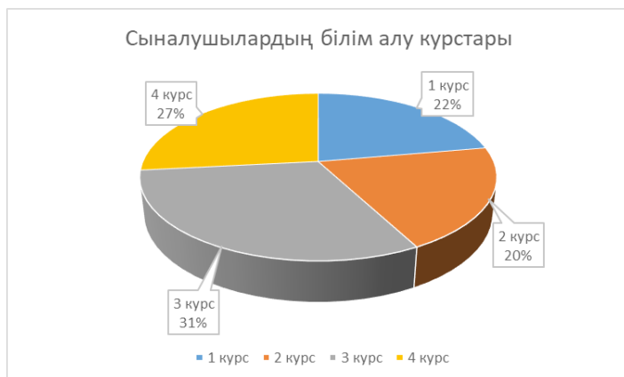
Сурет 4 – білім алу курсы бойынша көрсеткіштері

Зерттеуге қатысқан 45 респонденттің курстық құрамы: 1 курс - 10, 2 курс – 9, 3 курс – 14, 4 курс – 12 студент.