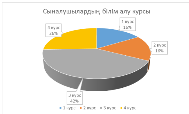
Сурет 1 – Білім алу курсы бойынша көрсеткіштер.

Психодиагностика практикасында бақылау локусы білім беру саласында, оның ішінде кәсіби тұрғыда көрінетін танымдық стильді бағалау үшін қолданылады. Психиканың когнитивті компоненттері оның барлық құбылыстарында болатындықтан, басқару локусы туралы түсінік оның іс-әрекетіндегі жеке тұлғаның қасиеттеріне де қатысты.