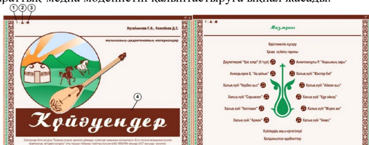
Сурет 1 – «Күйәуендер» атты электронды білім қайнары

білім көздерін тез табу және қол жетімділік мәселесін шешілді (онлайн сөздіктермен, энциклопедиялармен, композиторлардың, ғалымдардың жеке сайттарымен және т. б. жұмыс жасау) Бесіншіден, электрондық білім беру қайнарларымен жұмыс істеу студенттердің ақпараттық құзыреттілігі мен ақпараттық-медиа мәдениетін қалыптастыруға ықпал жасады.