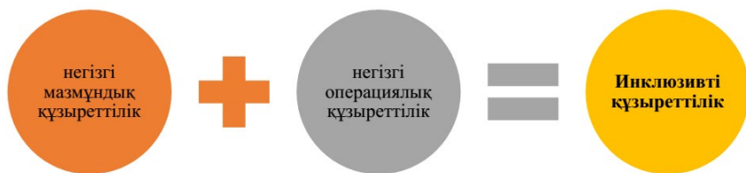
Сурет 1 – Инклюзивті құзыреттіліктің құрамдас бөліктері

Мұғалімнің инклюзивті құзыреттілігінің құрылымына мұғалімнің инклюзивті құзыреттілігінің компоненттері ретінде қарастыратын негізгі мазмұндық (мотивациялық, когнитивтік, рефлексивтік) және негізгі операциялық құзыреттіліктер кіреді (Сурет 1).