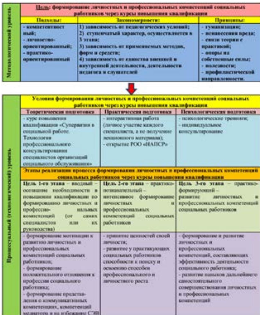
Рисунок 1 – Теоретическая модель формирования личностных и профессиональных компетенций социальных работников через курсы повышения квалификации, лист 1