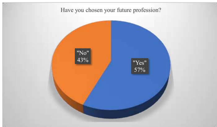
Figure 1 – Respondents' answers to the first question

On the second question, the following results were obtained: 42.5 % of students believe that they should think about their future profession at the age of 12-14, 35.8 % – at 14-16 years old, 21.7 % – at 16-18 years old. These answers confirm our opinion about the need for professional self-determination at an early age (12–14 years).