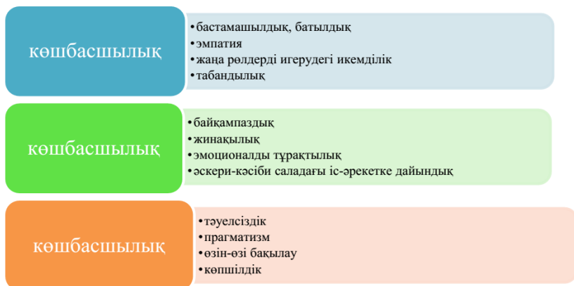
Сурет 1 – Көшбасшы-курсант бойындағы қабілеттер

Зерттеу базасы: ҚР ҰҚК Шекаралық Академия.