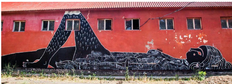
Рисунок 2 – Мурал, посвященный городу Алматы

На практике обучающиеся могут проанализировать и выявить особенности феномена сближения и взаимодействия симфонической и популярной музыки, например, один из трендов современной массовой музыкальной культуры – исполнение симфоническим оркестром рок-композиций или саундтреков к фильмам. Анализ современной массовой литературы дан через одну из характерных особенностей массовой культуры – интертекстуальность – обращение к культурной памяти читателя, к культурным фрагментам, отсылающим читателя или слушателя к другим культурным единицам. На практике студенты могут сравнить авторское кино и голливудские блокбастеры и охарактеризовать современный кинематограф как явление массовой культуры.