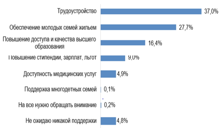
Рисунок 2 – Распределение ответов на вопрос: «На что необходимо обратить внимание в реализации государственной молодежной политики в первую очередь?», в %

Ничего не слышали о молодежной политике, проводимой в стране респонденты г. Алматы (23,5 %), Северо-Казахстанской области (22,6 %) и г. Нур-Султан (13,9 %).