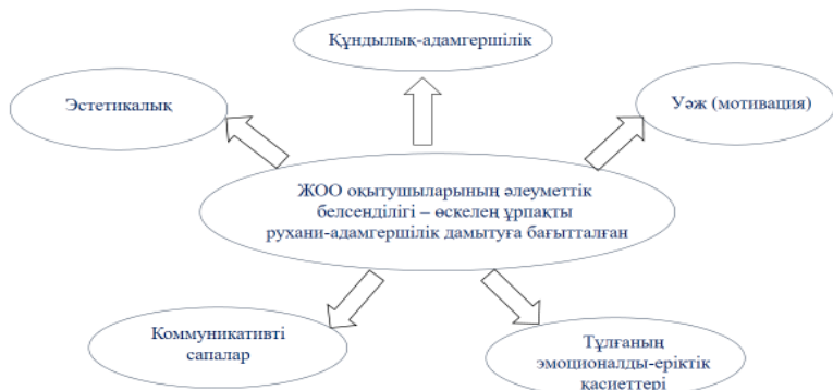
1-сурет – ЖОО оқытушыларының кәсіби-тұлғалық сипаттамалары

Ұсынылған үлгінің басты өзегі болып ұлттық менталитет, мәдени әдет-ғұрып, тіл мен тарих табылады. Мұндай тәсіл бұл модельдің жас ұрпақты рухани және адамгершілік тұрғыдан дамытуға бағытталғанын айқын көрсетеді. Сонымен қатар оқытушы тұлғасының әлеуметтік белсенділігі тәрбиелік және ұйымдастырушылық қызметті жүзеге асыру үшін әлеуметтік маңызы жоғары біліктерді игеруді қажет етеді.