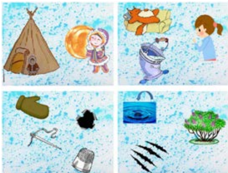
Рисунок 1 – Опорные сигналы к сказке Айога