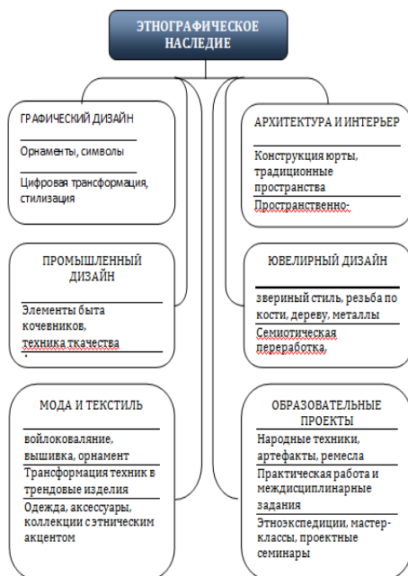
Схема 1 – Интерпретация этнографического наследия в различных направлениях дизайна

рамках исследования были разработаны тематические проекты для различных направлений подготовки (графический, промышленный, архитектурный и арт-дизайн), в которых этнографическое наследие становится основой для творческой интерпретации.