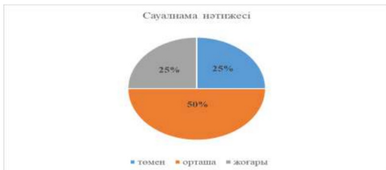
Сурет 2 – Сауалнама әдісінің көрсеткіші

Сауалнама нәтижесінде болашақ әлеуметтік педагогтардың кәсіби біліктілік деңгейі 25 % төмен, 25 % жоғары, 50 % орташа деген нәтиже алынды (2 сурет). Атап айтқанда болашақ мамандар өз біліктіліктерін арттыру кезінде өзін-өзі жүзеге асыруды, өзін дамытуды маңызды деп санамайды. Яғни, студенттердің басым бөлігінде құзыреттіліктер қалыптаспаған. Бұл дегеніміз болашақ мамандардың әлі де кәсіби біліктілігін, өзін-өзі жүзеге асыруын дамыту қажеттігі анықталды.